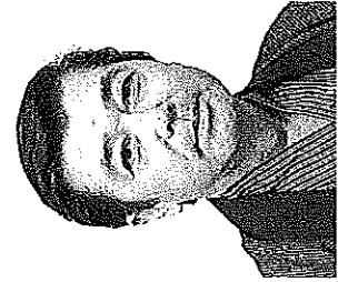
たけおし 無我さん (俳優)

「ヒロトの歌声」と呼ばれたあかちゃん、戦前から戦後にかけて多くのヒット曲を出した。NHK紅白歌合