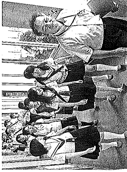
大阪府立茨香高校の学校説明会で、教師に引率されて校内を見学する中学生(大阪府池田市)