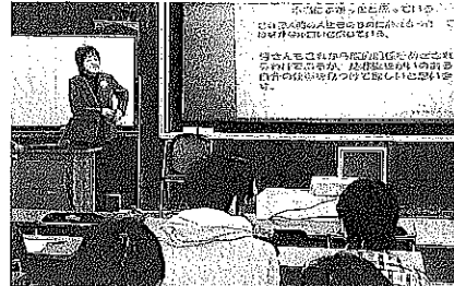
産婦人科医の講演を聞く新潟県立長岡高校のメディカルコースの生徒(新潟県長岡市)