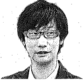
ゲームデザイナー 小島 秀夫さん

「こゝまでお、東京都生まれ。コナミデジタルエンタテインメント社でゲーム開発。代表作「メタルギア」シリーズは累計3千万本以上の世界的ヒット。2001年米ニューヨークに拠点を移す。切の指10人に選ばれた。49歳。ゲーム界と出会い、大学を卒業してコナミに入社しました。新人ながらゲーム作品の企画を任されたものの、コングガ分ならずボツに。周囲に評価されな私にの面倒を見てくれたのが